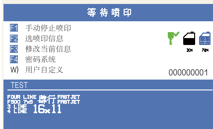
简洁高清的操作界面