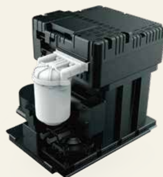
可快速维护的墨水系统