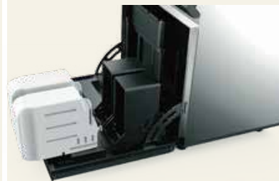
快速、整洁的耗材添加