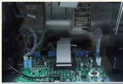
高度集成的多合一电路板